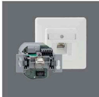
AC WLAN UAE Up rw 226 104 03

Der WLAN-Accesspoint von Rutenbeck findet weltweit als erster in einer handelsüblichen Up-Installationsdose Platz und passt zudem zu allen Designprogrammen namhafter Schalterhersteller.