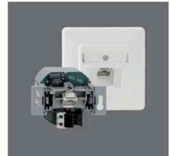
AC WLAN POF/UAE 1xUp rw 2,2 mm 226 104 05

Up-WLAN-Accesspoint; mit Zentralstück und Abdeckplatte; 150 Mbit/s; 802.11 b/g/n; WEP/WPA2; Betriebsart auch als Bridge, Repeater, Station; integrierter Datenauslass (RJ45) 100 Mbit/s; Netzwerkanschluss über Schraubklemmen; Nennbetriebsspannung 100–240 V~/50–60 Hz, 3 VA typisch; reinweiß (ähnlich RAL 9010); 80 x 80 x 50 mm; 112 g