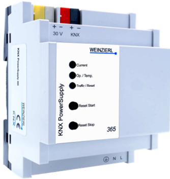
KNX PowerSupply 365