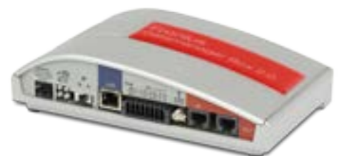
/ Fronius Datamanager Box 2.0