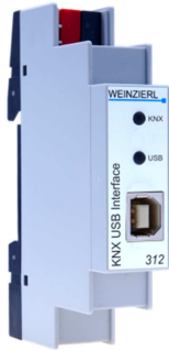
Foto des Geräts

Kompakte USB Schnittstelle zwischen PC und KNX-Bus