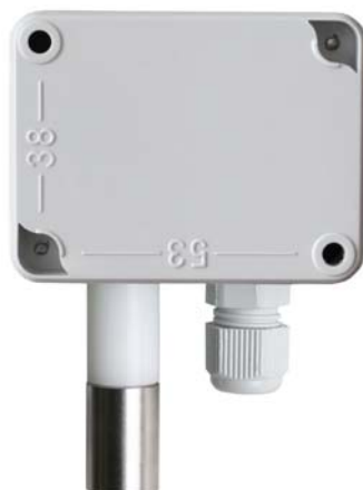
Abb. 2 Rückansicht mit Bemaßung der Öffnungen für die Befestigung