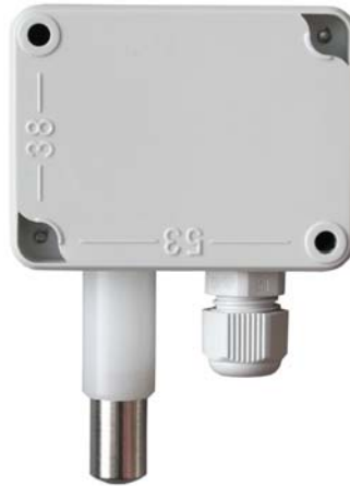
Abb. 2 Rückansicht mit Bemaßung der Öffnungen für die Befestigung