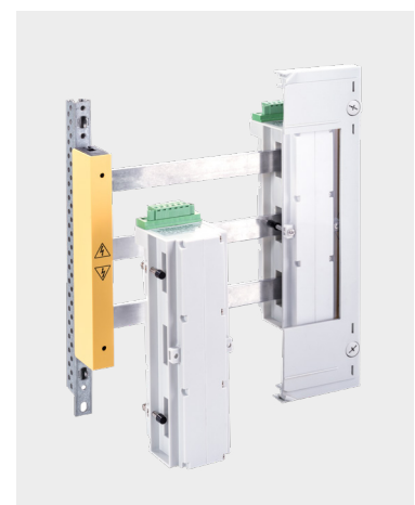
Montage im Installationsverteiler