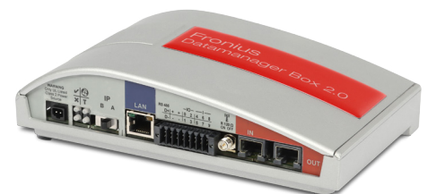
/ Fronius Datamanager Box 2.0